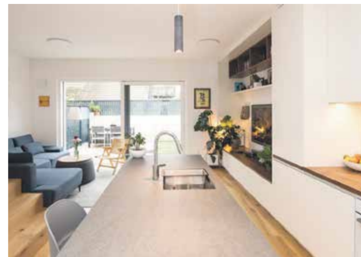
Lastniki so si želeli svetel in prijeten dom, v opremo pa vključiti tudi nekatere kose pohištva iz prejšnjega bivališča.