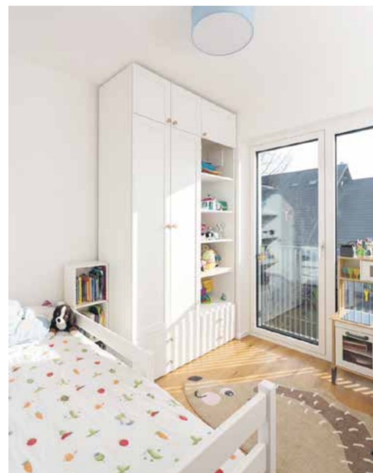
Otroški sobi so zasnovali po željah otrok in tako, da bosta lahko rasli z njimi ter se prilagajali novim potrebam.

»Pri vsaki zasnovi so določene omejitve zlasti pri uporabi dražjih materialov, izdelkov, ki smo jih v tem interierju z zmerno količino tudi uspešno vključili in poudarili,« še odgovarjajo arhitekti.