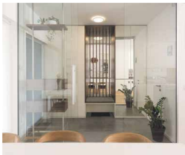
V pritličju je vhod v vetrolov, ki se vizualno nadaljuje v jedilni del, kuhinjo in naprej v dnevno sobo z izhodom v atrij.

Glavni poudarek stanovanja je harmonija prostora, kjer se volumen polnega in praznega v obliki prostora in opreme v svetlih odtenkih dopolnjuje s površinami lesa, kot sta oreh in hrast.