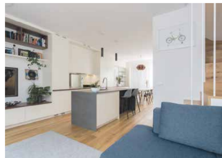
»Bivalni prostor smo videli kot priložnost, da družina tam skupaj preživlja čas – kuha, obeduje, poslušajo glasbo, dela domače naloge ali gleda film,« so pojasnili arhitekti.