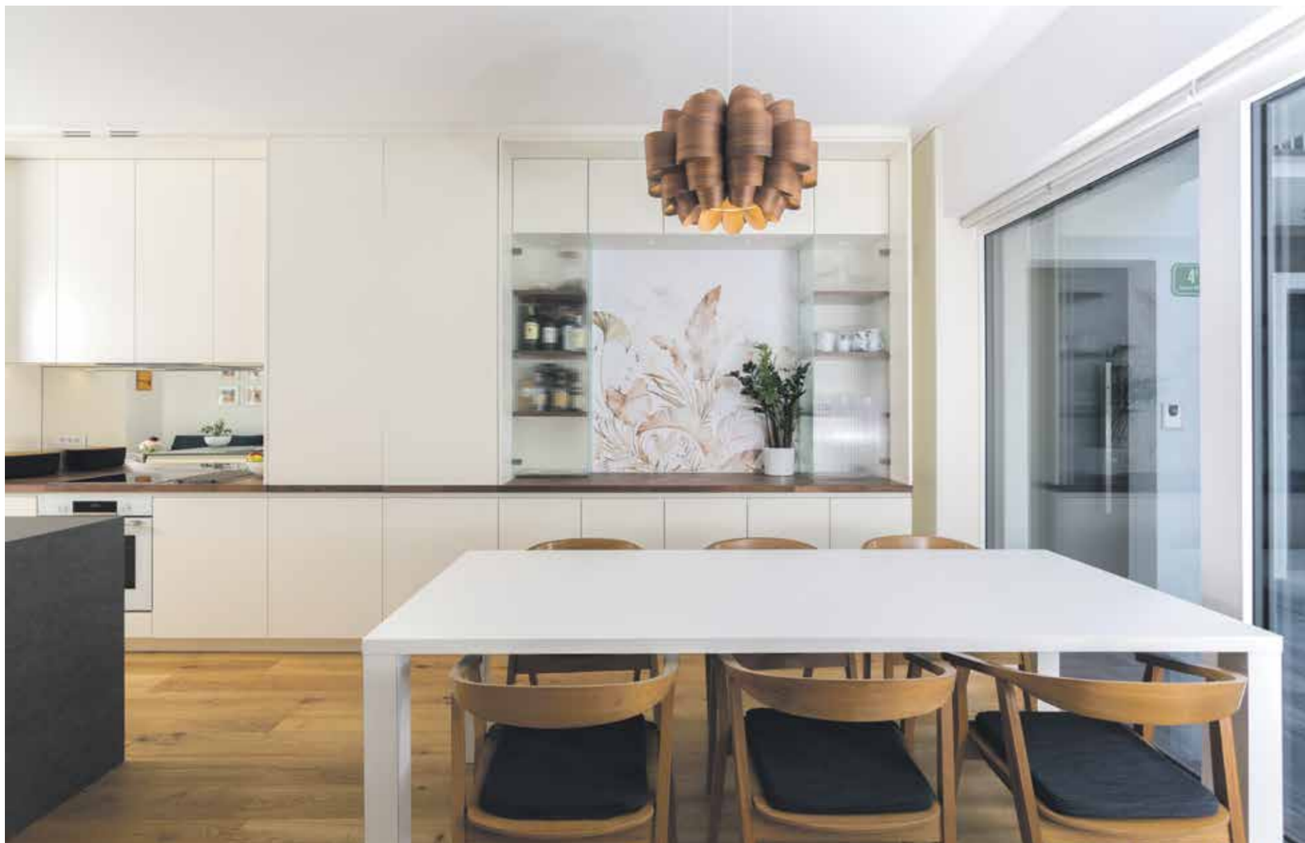
V jedilnem delu so v dolgem nizu opreme umestili preoblikovano kredenco, ki s polprosojnim steklom delno skriva svojo vsebino.